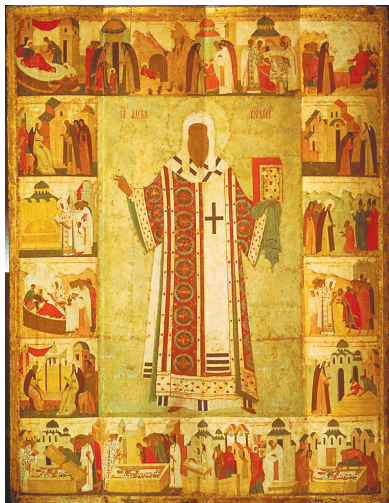
Митрополит Алексей. Икона. Иконописец Дионисий. XV в.

лись тогда верные соратники — московские бояре и глава Русской церкви митрополит Алексей. Они повели борьбу за возвращение ярлыка в Москву. В конце концов Дмитрий Иванович стал великим владимирским князем. А ещё через несколько лет московский и суздальский князья окончательно помирились. Дмитрий Иванович женился на княжне Евдокии, дочери суздальского князя.