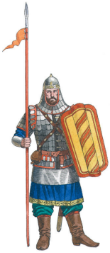
Русский воин. XIV в.