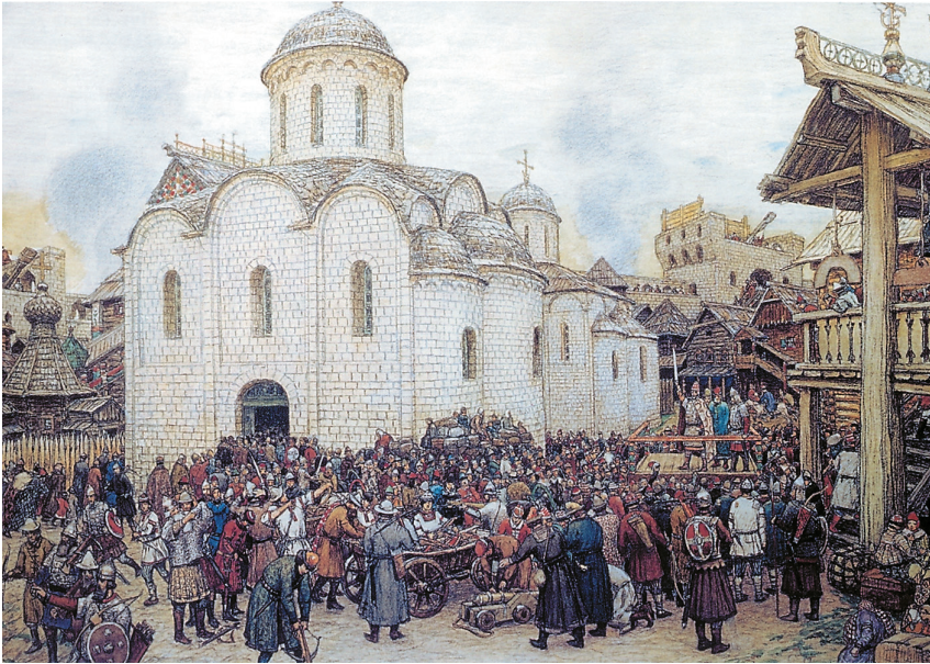
Оборона Москвы от войск Тохтамыша. Художник А.М. Васнецов. 1918 г.

ные приращения. Дмитрий Донской был уверен, что время, когда Русь освободится от ордынского владычества, близко. В своей духовной грамоте (завещании) князь писал, что, «если ослабит Бог Орду», детям его «не придётся платить выход в Орду».