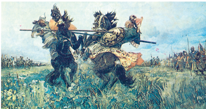
Поединок Пересвета с Челубеем. Художник М.И. Авиллов. 1943 г.

По преданию, битву начал поединок могучего ордынского богатыря с русским иноком Пересветом. Оба единоборца погибли в схватке. Появившаяся ордынская конница обрушилась на русские полки. Битва была жестокой. Ордынцы всё теснили и теснили русские ряды, был смят сторожевой полк. Мамай стремился расчленить русские войска надвое, часть — окружить и уничтожить, а часть — рассеять. Великий полк Дмитрия с трудом держался. Однако после двух часов жестокой битвы ордынцы начали одерживать верх. Казалось, ещё немного, и всё будет кончено, как это бывало во время монголо-татарского нашествия. И тут из соседнего леса на врага обрушился засадный полк. Это решило исход битвы. Воодушевлённый великий полк тоже перешёл в наступление. Ордынцы сражались упорно, но под натиском свежих русских сил в конце концов дрогнули и побежали. Их гнали и гнали. Разгром ордынцев был полным, русские захватили даже ордынский лагерь с богатой добычей. Узнав о разгроме Мамайя, Ягайло повернул своё войско назад.