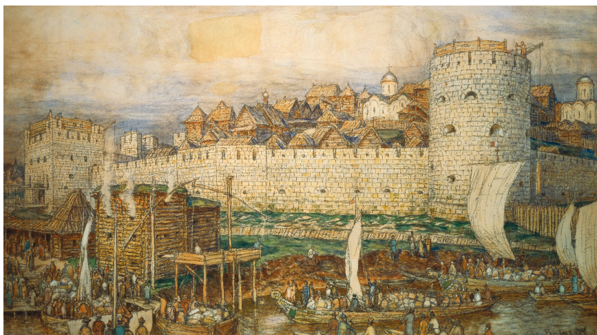
Кремль при Дмитрие Донском. Художник А.М. Васнецов. 1922 г.

Это оказалось очень вовремя. Восстановившая свои силы Тверь вновь вступила в борьбу за власть над Северо-Восточной Русью.