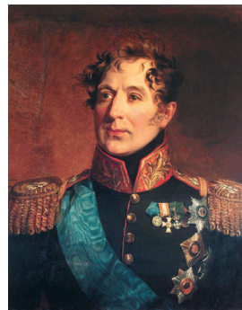
М.А. Милорадович. Художник Д. Доу

К следствию по делу декабристов, которое длилось несколько месяцев, было привлечено около 600 человек, 121 из них был предан суду.