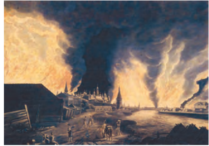
Пожар Москвы в 1812 г. Художник Х.И. Олендорф

Эта дорога уже была разорена самими завоевателями, и Великая армия таяла от голода и болезней, а также морозов, ударивших в конце октября. Из-за