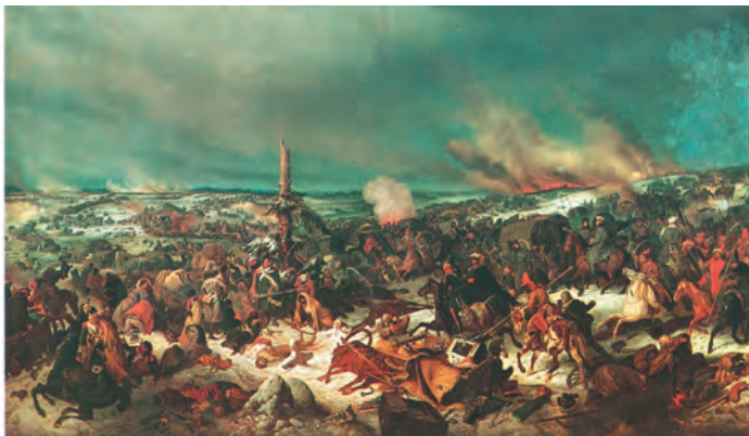
Переправа через реку Березину. Художник П. Гесс

падежа лошадей приходилось бросать по дороге тяжёлые артиллерийские орудия, а затем перестала существовать и сама кавалерия. Русская армия преследовала противника, двигаясь параллельной дорогой, и наносила ему чувствительные удары.