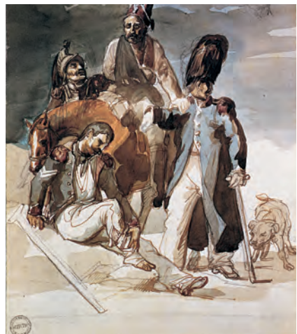
Французские солдаты возвращаются из России. Художник Т. Жерико. 1814 г.