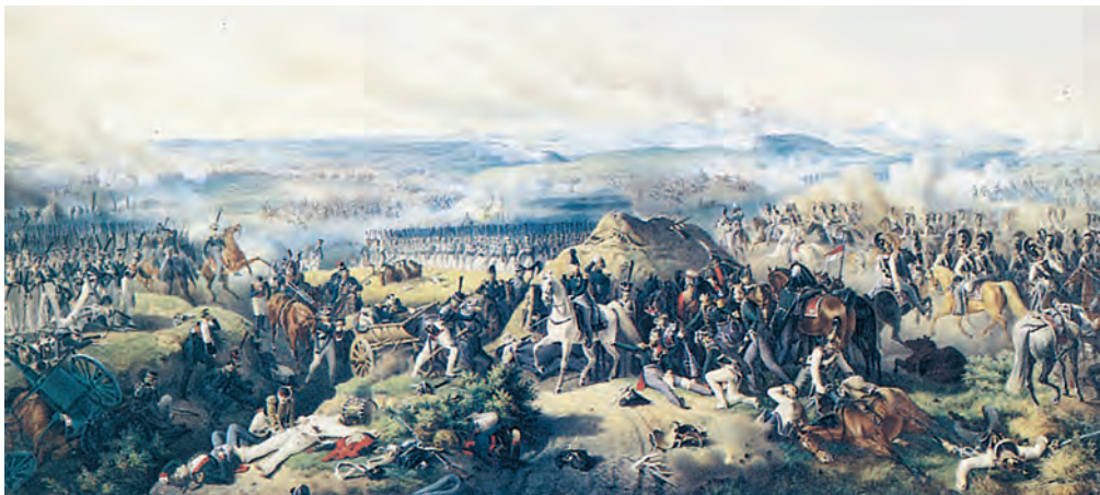
Бородинское сражение. Художник П. Гесс

3. Бородинское сражение. Александр I, по-видимому, хорошо знал и вполне одобрял стратегию Баркляя. Однако общественное мнение было настроено против главнокомандующего, поэтому император решил сместить его с этого поста. Для выбора нового вождя армии был создан чрезвычайный комитет, который единогласно назвал имя М.И. Кутузова.