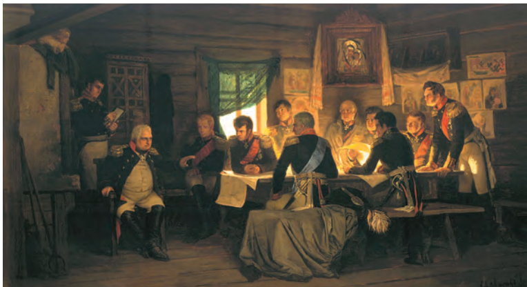
Военный совет в Филях. Художник А.Д. Кившенко

4. Оставление Москвы и Тарутинский марш-манёвр. После отступления к Москве перед Кутузовым встал вопрос о сражении у стен древней столицы. 1 сентября главнокомандующий созвал военный совет в селе Филях у западной окраины города. Выслушав аргументы «за» и «против» нового сражения, Кутузов принял трудное решение: ради сохранения армии сдать Москву без боя.