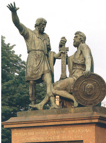
Памятник Минину и Пожарскому в Москве на Красной площади. Скульптор И.П. Мартос. 1818 г.

В Ярославле в апреле 1612 года образовался второй «Совет всея земли» , сформировались приказы для управления страной. Население многих русских городов деятельно участвовало в создании ополчения.