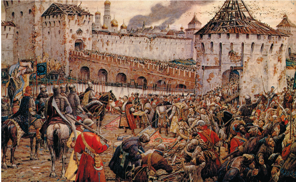
Освобождение Кремля от поляков. Художник Э.Э. Лиснер. 1930-е гг.

22 октября 1612 года, в день Казанской иконы Богоматери, был освобождён Китай-город. Впоследствии в память об этом на Красной площади Москвы возвели Казанский собор.