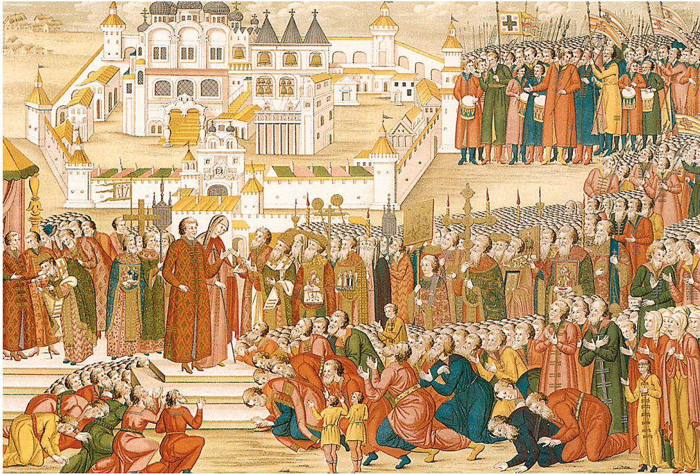
Призвание Михаила Фёдоровича Романова на царство. Миниатюра. XVII в.

Подвиг Сусанина воспет во многих замечательных творениях русской культуры, в том числе в опере гениального русского композитора М.И. Глинки «Жизнь за царя».