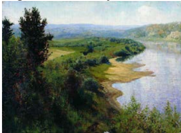
Василий Угрюмов. Река

Продолжаем путешествие. Впереди река. Слайд № 5