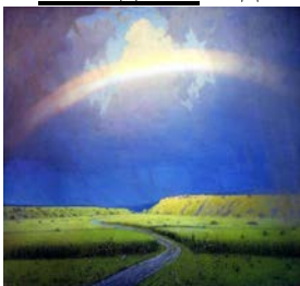
Ирина Литвин Архангельск. Вид на реку

1. Тебе одной плету венки, Цветами сыплю стезю серую. О Русь, покойный уголок, Тебя люблю, тебе и верую.