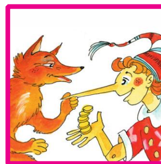
водить за нос

В русском языке есть устойчивые сочетания — фразеологизмы . Их часто можно заменить одним словом.