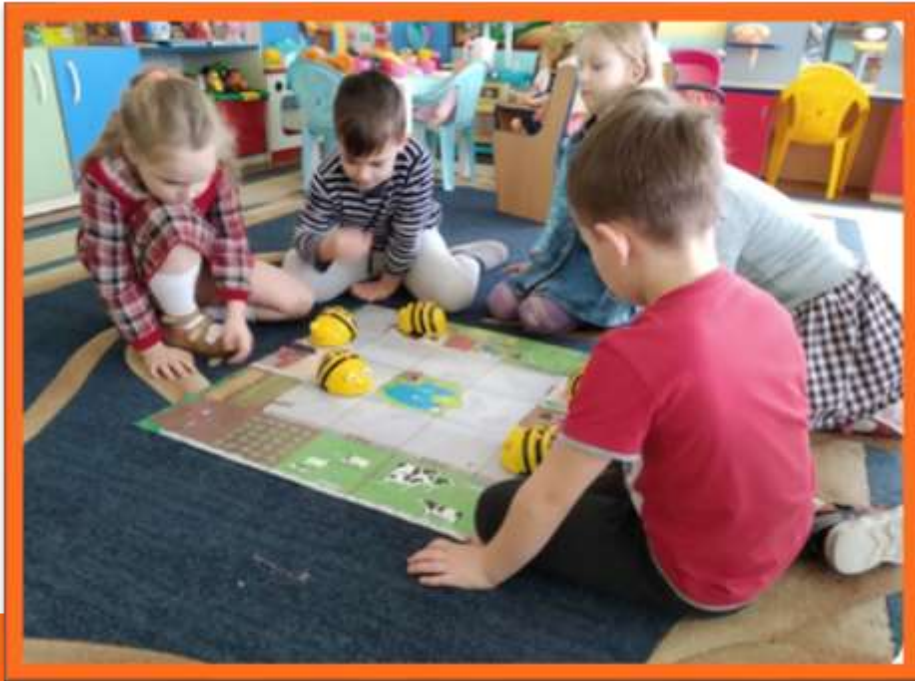
Клуб по интересам «Умные пчёлы»