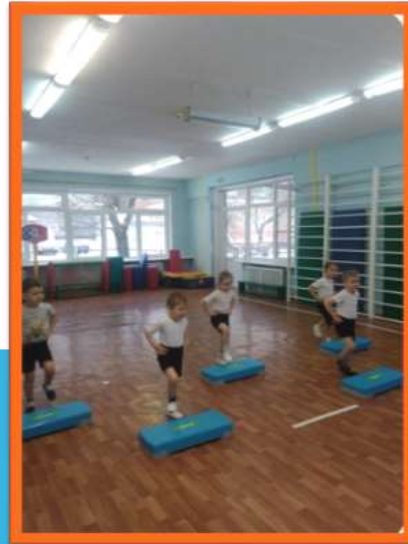
Спортивная секция по степ-аэробике «Kids-step»