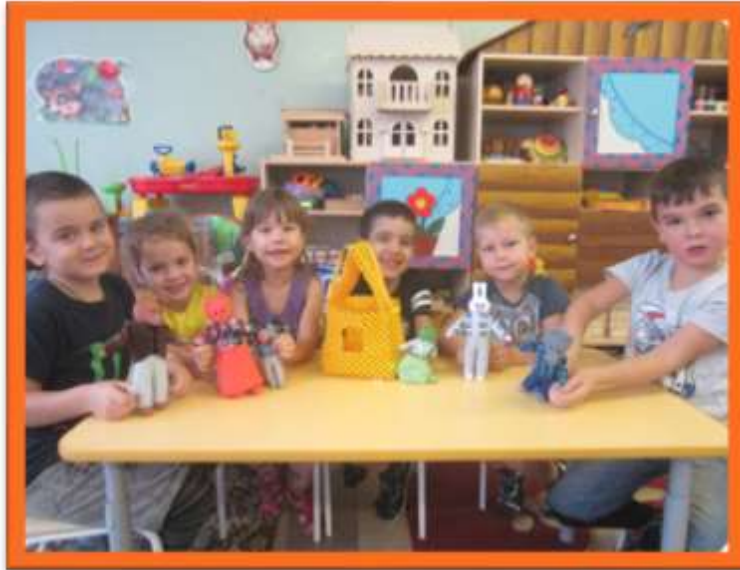
Кружок «Приходите в наш театр»